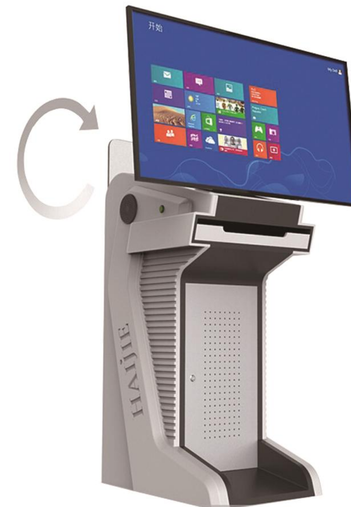
(图片仅供参考，请以实物为准)